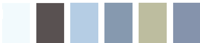
0117 weiß 0132 braun 0138 lichtgrau 0146* grau 0147 beige 436As alu metallic (M40/22)

Unverbindlich empfohlene Verkaufspreise in Euro, inklusive MwSt., 1. März 2009