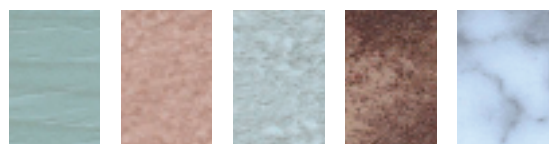
W 060 ahorn grün W 061 terracotta rot W 062 terracotta grau W 067 terracotta dunkelrot W 068 marmor